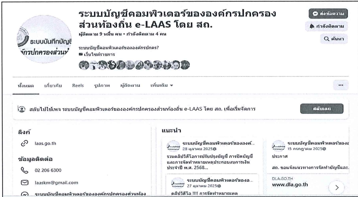
๓. ผ่าน Facebook เพจ “ระบบบัญชีคอมพิวเตอร์ขององค์กรปกครองส่วนท้องถิ่น e-LAAS โดย สก.”